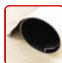
丸めてコンパクト収納