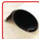
丸めてコンパクト収納