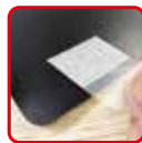
透明タブを裏面に貼ってください。