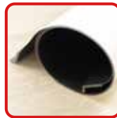
丸めてコンパクト収納