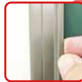
簡単に貼ってはがして ワンタッチイージーバー