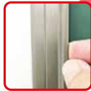
簡単に貼ってはがして ワンタッチイージーバー