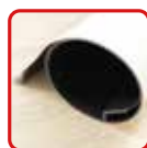
丸めてコンパクト収納