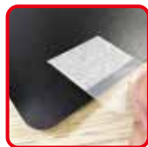
透明タブを裏面に貼ってください。