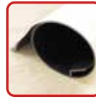
丸めてコンパクト収納