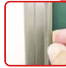
簡単に貼ってはがして ワンタッチイージーバー