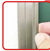
簡単に貼ってはがして ワンタッチイージーバー