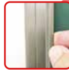
簡単に貼ってはがして ワンタッチイージーバー