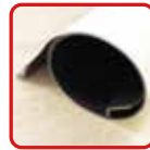
丸めてコンパクト収納