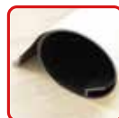
丸めてコンパクト収納